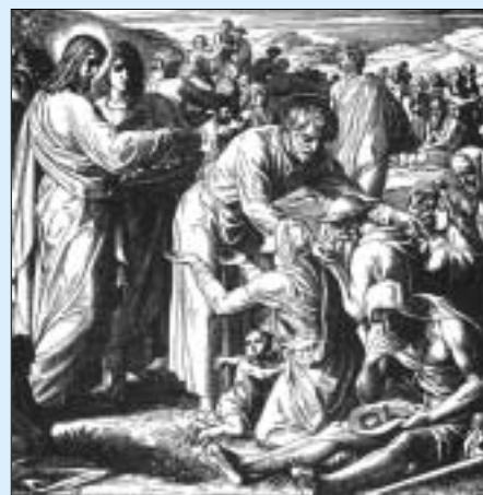
G. Doré - Zázračné rozmnoženie chleba a rýb

Górakša a vegetariánstvo, s. 8 – brožúrka Medzinárodnej spoločnosti pre uvedomovanie si Krišnu