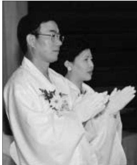
Kórejskí manželia žehnajú v Munovom mene

Munove náboženské názory nevyrastajú z kresťanských koreňov. V jeho učení sú prítomné prvky viacerých náboženských systémov. Jeho „teológia“ je výsledkom vlastných teórií a úvah. Z mimokresťanských vplyvov je tu napríklad odraz taoistickej polarizácie prvkov jin a jang prejavujúci sa v chápaní Boha v dualite mužsko-ženskej. Munova koncepcia mesiáša je tiež blízka konfucionistickým predstavám o spravodlivom Jin-Inovi, či budhistickom Maitreyovi a je ovplyvnená kórejskou