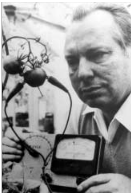
Ron Hubbard s jeho neodmysliteľným „ vynálezom“ – elektropsychometrom