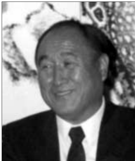
San Mjung Mun