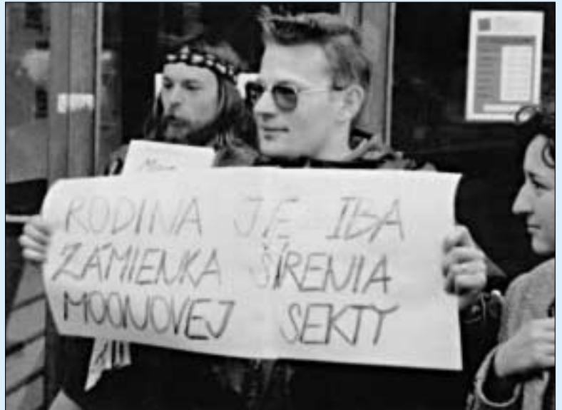
Pred Športovou halou demonštrovalo niekoľko odporcov učenia rev. Muna

Koncom minulého a začiatkom tohto roka sa vo viacerých slovenských mestách konala podpisová kampaň Federácie rodín za svetový mier, ktorá vyzývala k podpore vernosti a manželskej láske v rodinách. Proti týmto hodnotám nemôže nikto z kresťanov namietkať, avšak treba si uvedomiť, že za týmto združením sa skrýva Cirkev zjednotenia (CZ), ktorej členovia sú známi – podľa jej zakladateľa reverenda S. M. Muna (v angl. transkripcii Sun Myung Moon) – ako munisti. Existuje preto obava, že skutočným cieľom tejto kampane nebolo proklamované zduchovnenie a očista rodiny, ale nábor a podpora CZ, ako aj vytváranie jej pozitívneho imidžu na verejnosti.