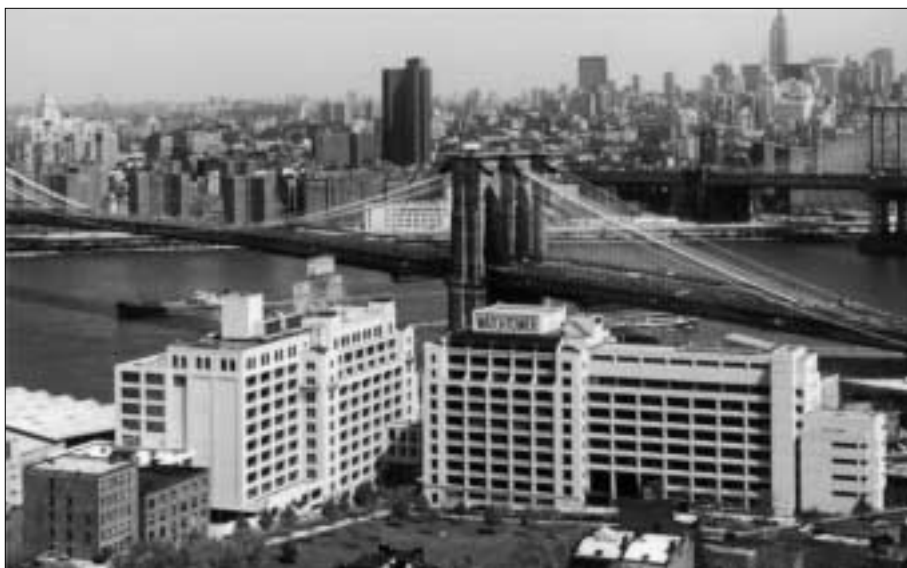
Ústredie organizácie Strážna veža v Brooklyne, USA