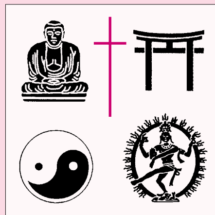
Symbole svetových náboženstiev

(Jak je to vlastne v Biblii?, str. 26, vydalo Nakladateľstvo Lotos)