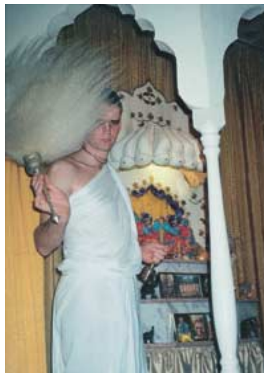
Oddaný Krišnu uctieva svoje božstvá

Objednávky predplatného prijíma výhradne redakcia!